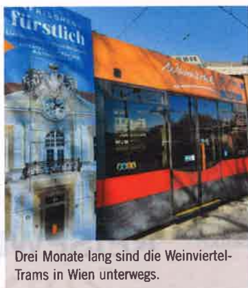
Drei Monate lang sind die Weinviertel-Trams in Wien unterwegs.

Drei Monate lang werden drei im Weinviertel-Design gebrandete Straßenbahn-Garnituren in Wien Lust auf genussvolle Weinviertler Gelassenheit wecken. Durch die unmittelbare Nähe lockt das Weinviertel mit exzellentem Wein, Kulinarik, Kunst, Kultur und Natur.