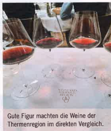
Gute Figur machten die Weine der Thermenregion im direkten Vergleich.

Leerstand-Sieger. Seit Jahren werden die Geschäftszonen der heimischen Städte von der Unternehmensberatungsfirma „Standort + Markt“ beobachtet und bewertet. Und dabei zeigte sich: Mödling ist die Nummer eins im Leerstands-Service: Die Quote beträgt nur 1,9 Prozent!