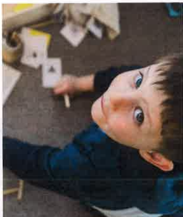
Mit der BOX kann man Museum spielerisch erleben.

Ab sofort können Besucher der Kunstmeile Krems die Ausstellungen und Kunstwerke mit der MY MUSEUM BOX spielerisch und mit allen Sinnen erkunden. Spannende Aufgabenstellungen und hochwertige Materialien sorgen für einen unterhaltsamen Museumsbesuch. Die handliche Box ist kostenlos an den Museumskassen zum Ausleihen erhältlich und richtet sich vorrangig an Familien mit Kindern.