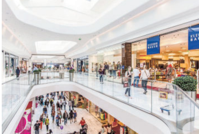
Die Schließung der meisten Geschäfte in Shopping-Centern und Innenstädten kostet 70 bis 80 Prozent des Umsatzes

Lagerflächen“, beobachtet Eugen Otto, Eigentümer von Otto Immobilien.